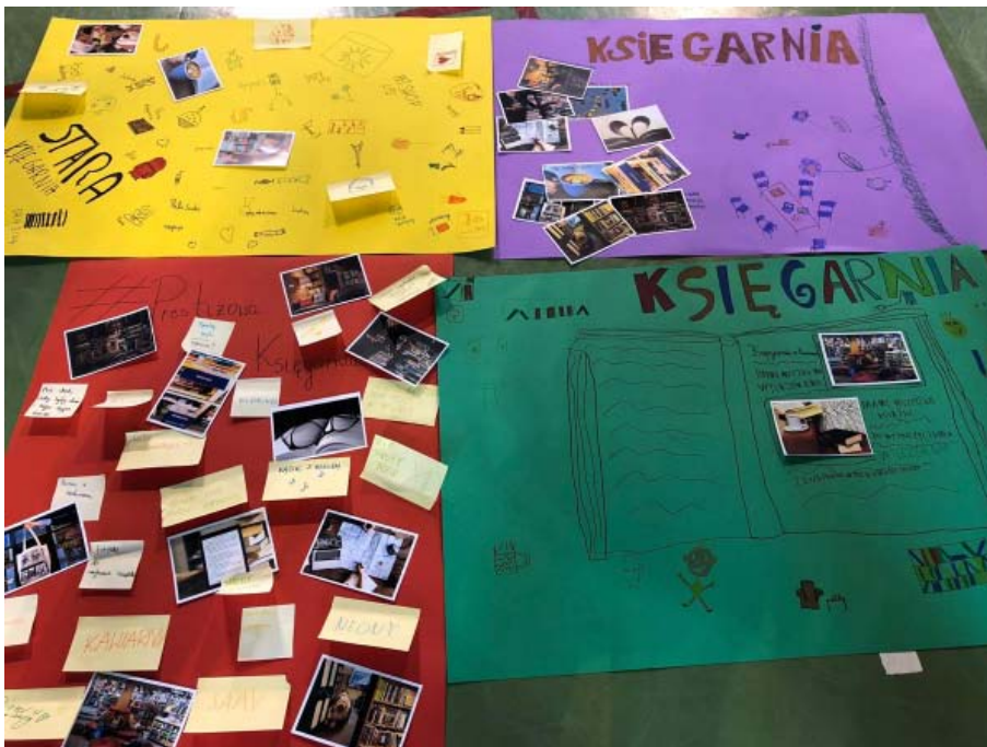
WARSZTAT KREATYWNY EFEKTY PRACY