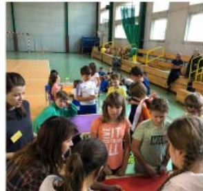
WARSZTAT KREATYWNY MOODBOARDY