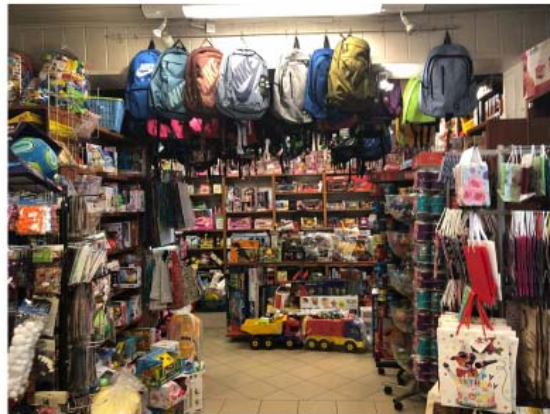
PRZYGOTOWANIA DO WARSZTATU, WIZYTA W STAREJ KSIĘGARNI

Dokumentacja fotograficzna wraz z analizą benchmarkingową (Załącznik nr.2) oraz informacjami zebranymi podczas pierwszego i drugiego etapu prac projektowych pomoże przy stworzeniu rekomendacji do planu rewitalizacji STAREJ KSIĘGARNI.