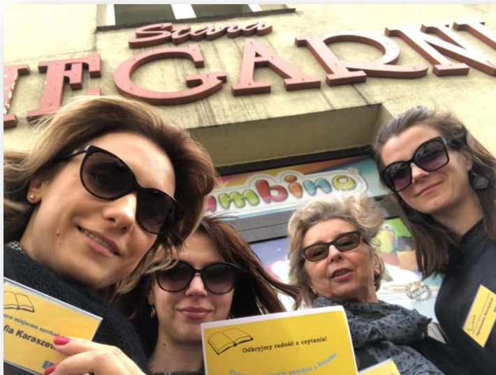
PRZYGOTOWANIA DO WARSZTATU, WIZYTA W STAREJ KSIĘGARNI

W ramach prac dokonano również dokumentacji fotograficznej aktualnego wyglądu STAREJ KSIĘGARNI.